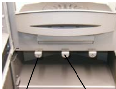
Primaire luchtregelaar Secundaire luchtregelaar

De primaire luchtregelaar bevindt zich links en de secundaire luchtregelaar rechts onder de vuldeur. Schuif naar buiten ⇒ open Schuif naar binnen ⇒ gesloten