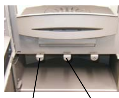
air primaire air secondaire

Le vérin à air primaire se trouve à gauche et le vérin à air secondaire se trouve à droite sous la porte d'alimentation.