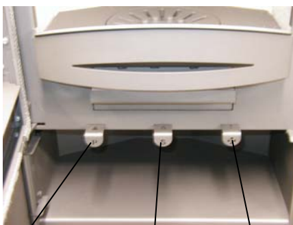
Primärluftsteller Sekundärluftsteller Rüttelrost