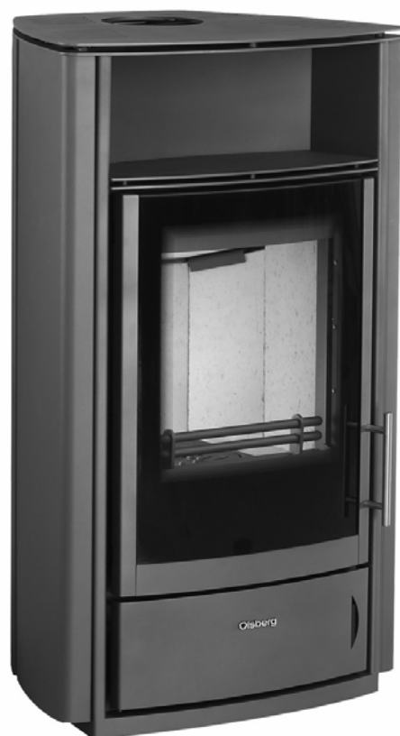
Kaminofen MAYON COMPACT