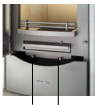
Primary air controller Secondary air controller

The primary air controller is located on the left-hand side of the loading door and the secondary air controller is located on the right-hand side beneath the loading door.