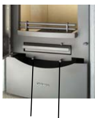
Regulador del aire primario Regulador del aire secundario

El regulador del aire primario se halla a la izquierda y el del aire secundario, a la derecha por debajo de la puerta de carga.