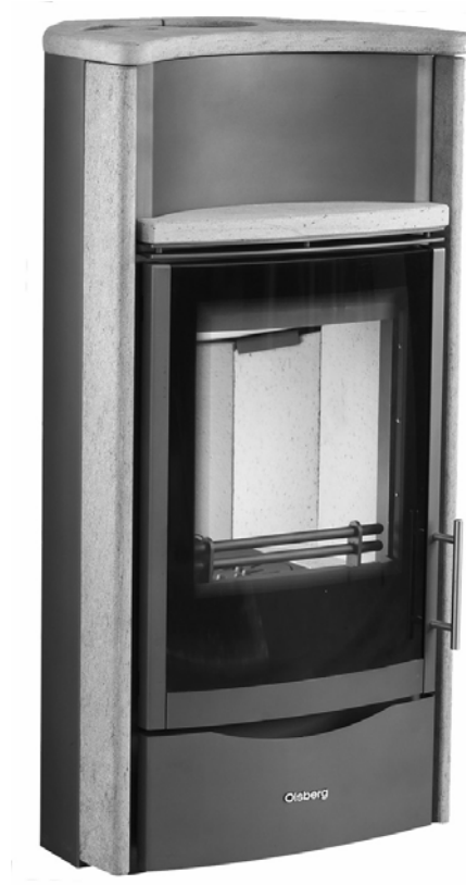
Kaminofen PAGO COMPACT