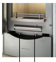
Primary air controller Secondary air controller

The primary air controller is located on the left-hand side of the loading door and the secondary air controller is located on the right-hand side beneath the loading door.