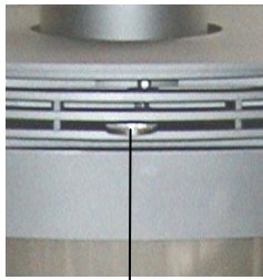
Regulador del aire primario Regulador del aire secundario

Registro hacia fuera ⇒ Abierto Registro hacia dentro ⇒ Cerrado