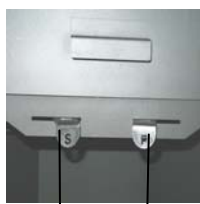
Vérin à air secondaire (S) Vérin à air primaire (P)

Le vérin à air primaire (P) se trouve à droite et le vérin à air secondaire (S) se trouve à gauche sous la porte d'alimentation.