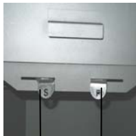
Secundaire luchtregelaar (S) Primaire luchtregelaar (P)

De primaire luchtregelaar (P) bevindt zich rechts en de secundaire luchtregelaar (S) links onder de vuldeur.