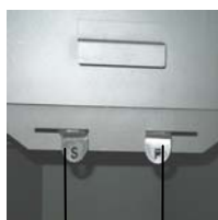
Secundaire luchtregelaar (S) Primaire luchtregelaar (P)

De primaire luchtregelaar (P) bevindt zich rechts en de secundaire luchtregelaar (S) links onder de vuldeur.