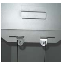
Vérin à air secondaire (S) Vérin à air primaire (P)

Le vérin à air primaire (P) se trouve à droite et le vérin à air secondaire (S) se trouve à gauche sous la porte d'alimentation.