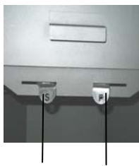
Regulador del aire secundario (S) Regulador del aire primario (P)

El regulador del aire primario (P) se halla a la derecha y el del aire secundario (S), a la izquierda por debajo de la puerta de carga.