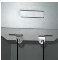
Sekundärluftsteller (S) Primärluftsteller (P)

Der Primärluftsteller (P) befindet sich rechts und der Sekundärluftsteller (S) links hinter der Fülltür.