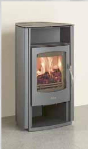
Mayon Stahlblech, gussgrau