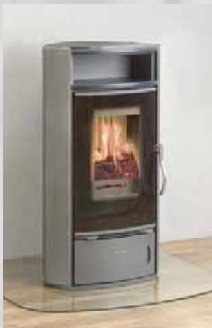
Pizzo Stahlblech, gussgrau