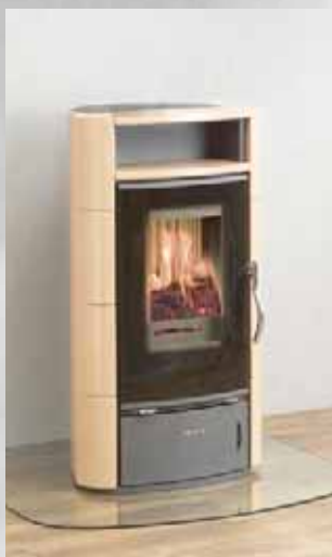
Pizzo Seitenverkleidung und Einleger apricot