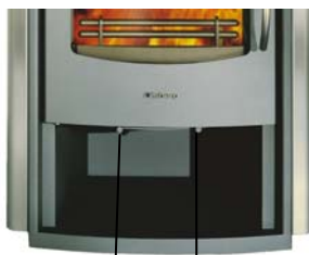
Primaire luchtregelaar Secundaire luchtregelaar

De primaire luchtregelaar bevindt zich links en de secundaire luchtregelaar rechts onder de vuldeur.