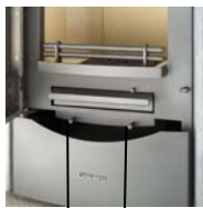
Vérin à air primaire Vérin à air secondaire

Le vérin à air primaire se trouve à gauche et le vérin à air secondaire se trouve à droite sous la porte d'alimentation.