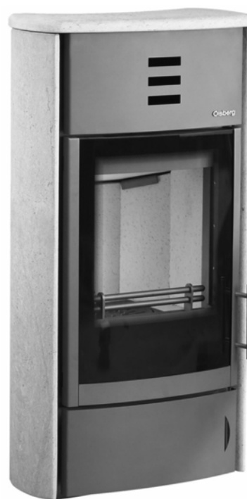
Kaminofen AGANDO COMPACT