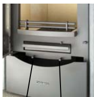
Regulador del aire primario Regulador del aire secundario

El regulador del aire primario se halla a la izquierda y el del aire secundario, a la derecha por debajo de la puerta de carga.