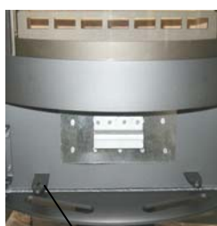
Vérin à air primaire