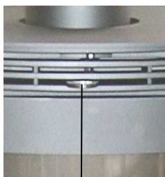
Regulador del aire primario