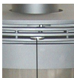
Vérin à air secondaire

Registre vers l'extérieur ⇒ Ouvrir Registre vers l'intérieur ⇒ Fermer