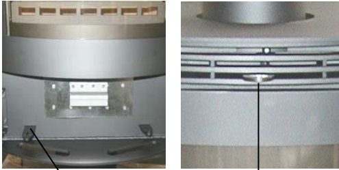
Primary air controller Secondary air controller

Move slide valve outwards ⇒ Open Move slide valve inwards ⇒ Closed