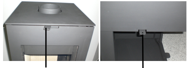
Secondary air controller Primary air controller

The primary air controller is located below the door and the secondary air controller above the door.