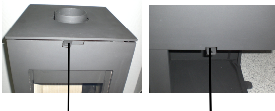
Regulador del aire secundario Regulador del aire primario

El regulador primario de aire está situado debajo la puerta, y el regulador secundario de aire encima de la puerta.