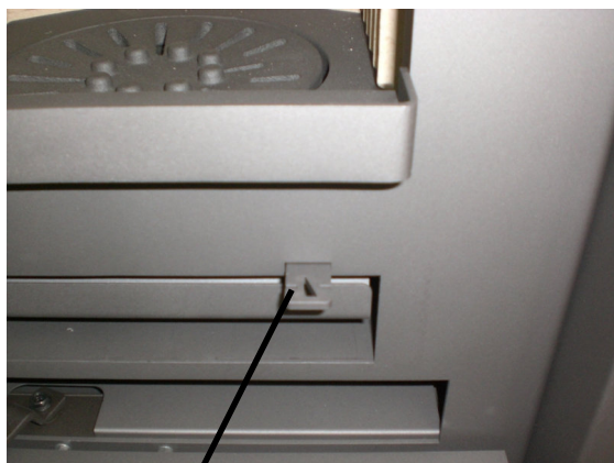
Levier de commande pour la grille du foyer