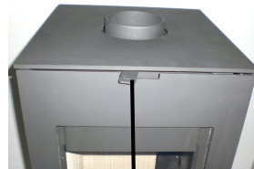
Vérin à air secondaire