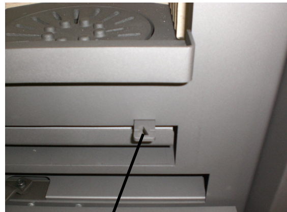
Regelhendel voor het vuurrooster

Met de regelhendel kan het vuurrooster geopend of gesloten worden, en kan de as uit de vuurkamer door het heen- en weerschuiven van het rooster in de aslade geschoven worden. Primaire lucht kan enkel in de vuurkamer komen wanneer het vuurrooster open staat.