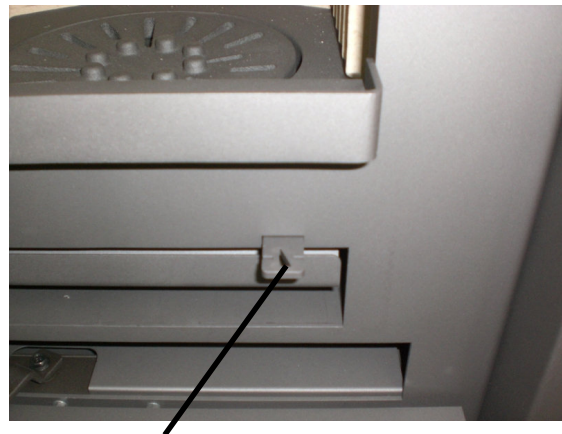
Palanca de uso para la parrilla