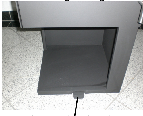
Lengüeta de accionamiento

Para girar el Pantoja, presione la lengüeta de accionamiento.