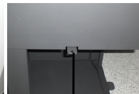
Vérin à air primaire

Le vérin à air primaire se trouve au-dessous de la porte du foyer et le vérin à air secondaire au-dessus de la porte du foyer.